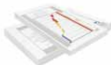
Regroupement et assemblage